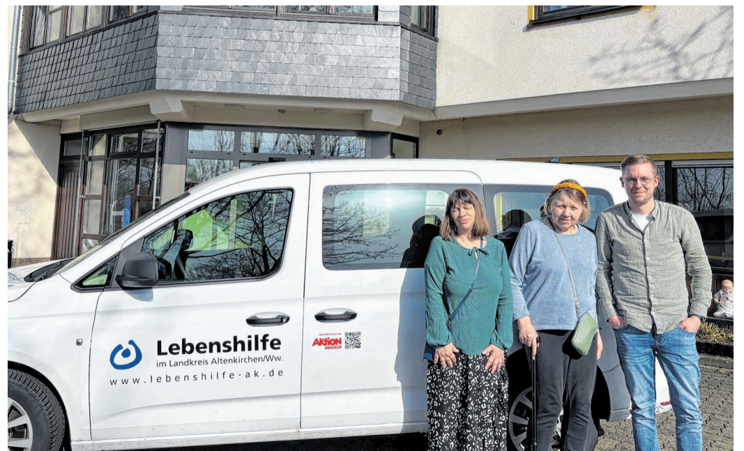
Neu und barrierefrei: Das neue Fahrzeug bringt die Bewohnerinnen und Bewohner der Wohnstätte Mittelhof-Steckenstein sicher und selbstbestimmt durch den Alltag.

Mit dem neuen Fahrzeug gewinnt die Wohnstätte nicht nur ein Transportmittel, sondern mehr Unabhängigkeit – und damit mehr selbstbestimmte Teilhabe.