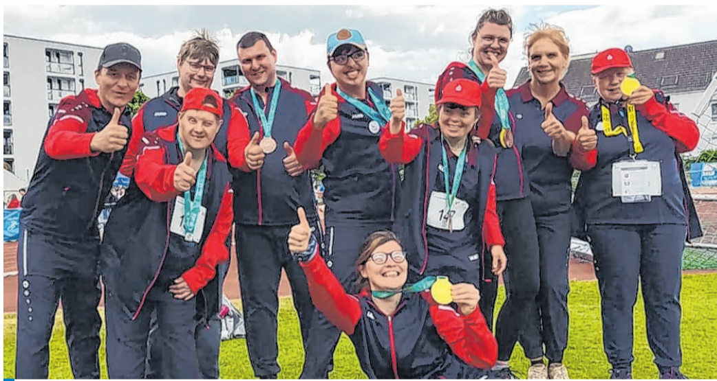
Gemeinsam aktiv: Sport verbindet Menschen in den Westerwald-Werkstätten und schafft Teilhabe durch Bewegung, Freude und starke Gemeinschaft.