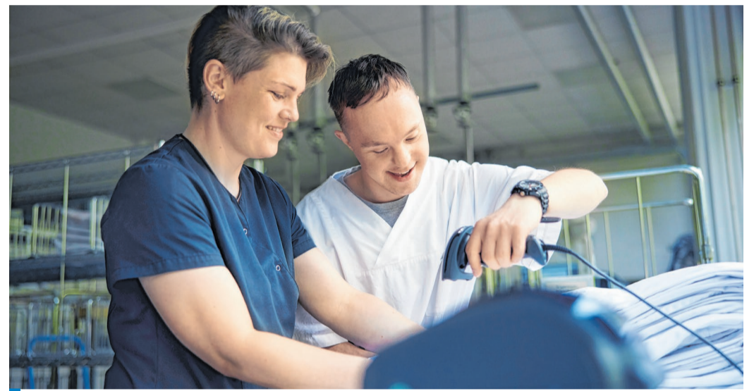
Mehr als Arbeit: In der Werkstatt der Lebenshilfe in Mittelhof entstehen seit 1977 Teilhabe, Selbstvertrauen und Gemeinschaft – Tag für Tag.

Die Werkstatt ist dabei weit mehr als Arbeitsplatz. Sie ist ein Ort der Begegnung, des Lernens, der Entwicklung. Hier wachsen Selbstvertrauen, Gemeinschaft und Lebensfreude. Arbeit bedeutet Anerkennung und Würde. Sie ermöglicht Menschen, ihre Fähigkeiten einzubringen und sichtbar Teil der Gesellschaft zu sein.