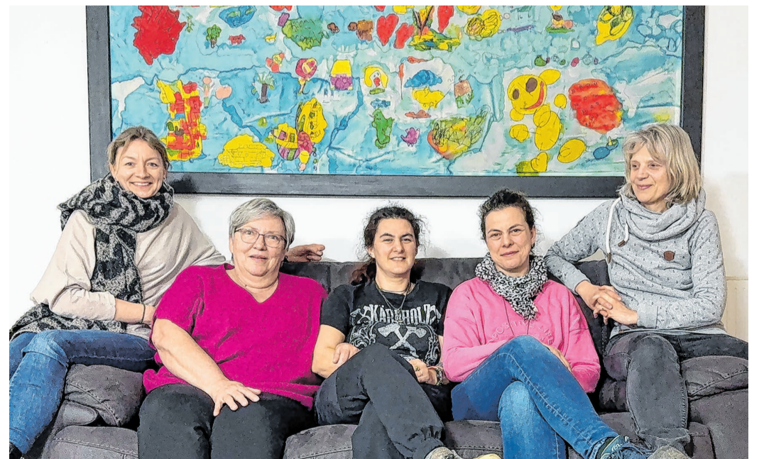
Der Elternstammtisch bietet Raum für Austausch und gegenseitige Unterstützung. „Wir stehen für unsere Kinder ein“, sagt eine Mutter – und beschreibt damit, was alle Teilnehmenden verbindet.

Deshalb ist es wichtig, dass sich Eltern untereinander stärken können. Herausforderungen zu teilen, gibt das Gefühl nicht allein zu sein – so wie im Elternstammtisch. Hier ist jeder willkommen, egal ob das Kind in die Kita geht oder schon erwachsen ist.